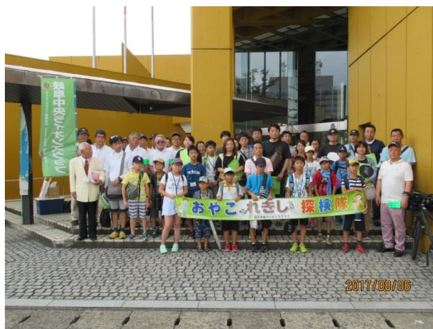
全員集合 出発です！

ところが有ったのかと、私にとってもいい一日でした。会場を最後に出る親子が息子が歴史が好きで、先週も関ヶ原の古戦場に行ってきたところで、今回もすごくよかった、来年も参加したいとハニカミながら言われるので、予約受付けますよ と言って送り出しました。暑い一日も良い思い出になることでしょう。