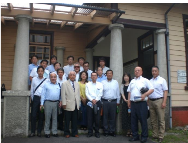
各務原航空自衛隊基地内 資料展示棟にて